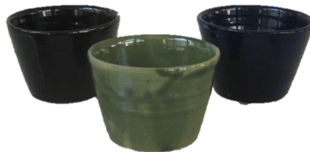
そば猪口をつくろう(陶芸)