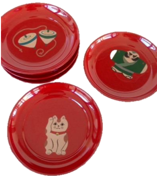
銘々皿に漆で絵を描こう