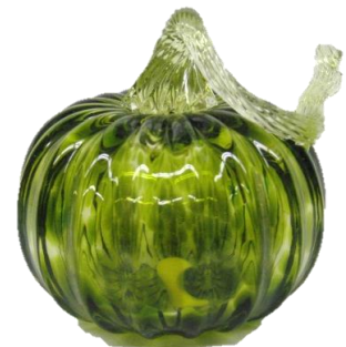
かぼちゃのオブジェをつくろう(ガラス)