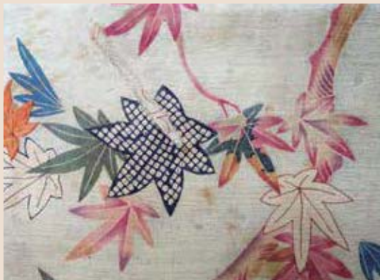
友禅染 金沢美術工芸大学所蔵