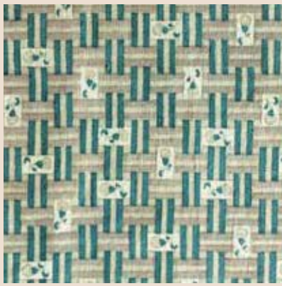
和更紗 金沢卯辰山工芸工房所蔵