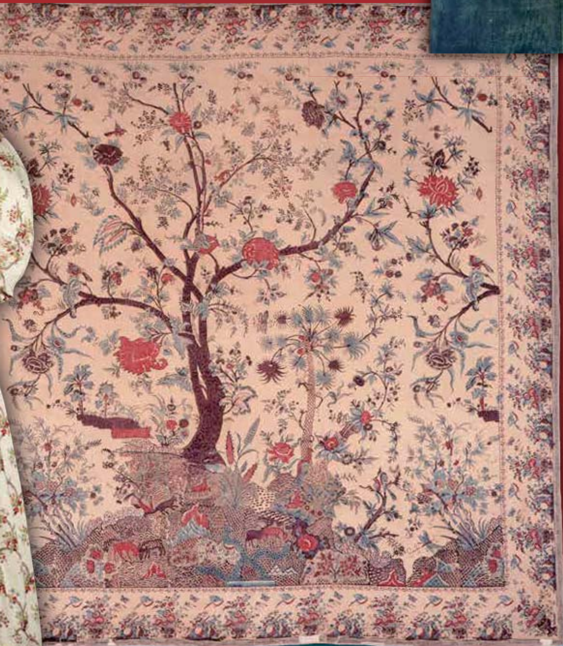
インド更紗 神戸ファッション美術館所蔵

平成27年 10月24日(土)~12月7日(月) 金沢卯辰山工芸工房 本館2階展示室