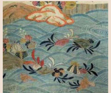
友禅染 金沢美術工芸大学所蔵