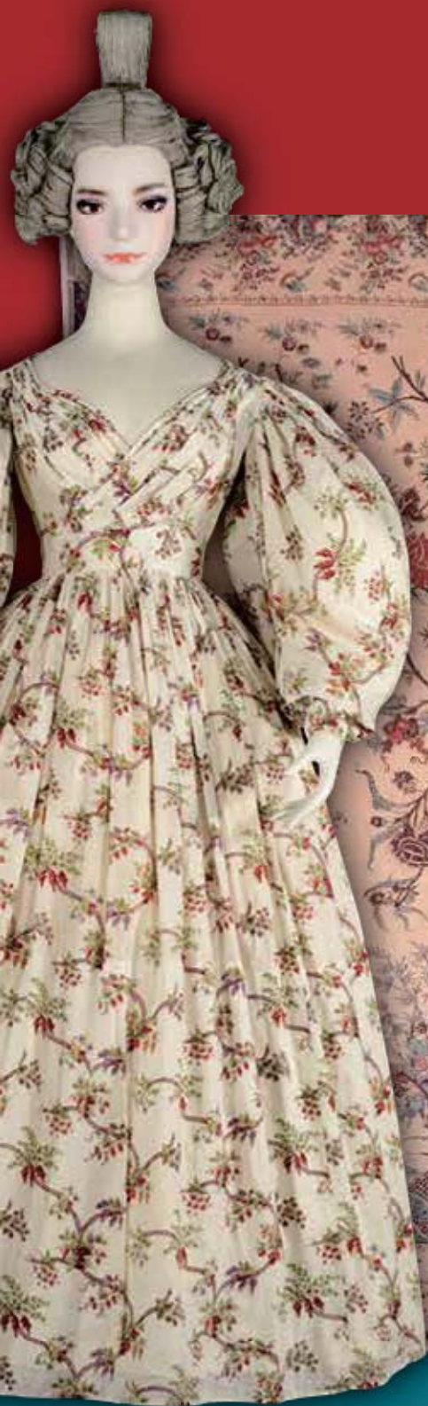
ヨーロッパ更紗 神戸ファッション美術館所蔵