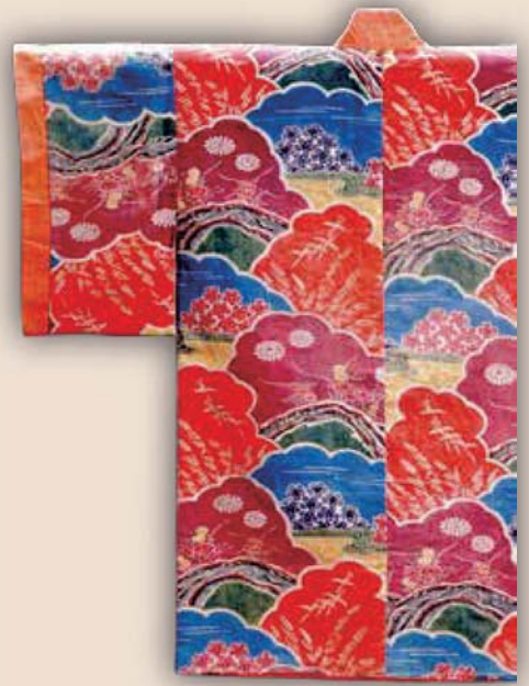
琉球紅型 神戸ファッション美術館所蔵