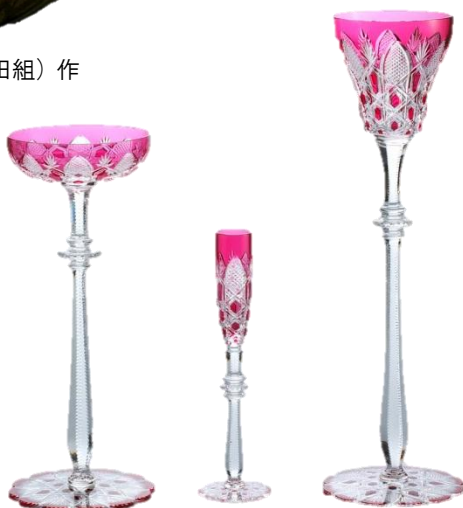
ツアー ローズ／バカラ