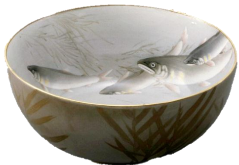
色絵群鮎図鉢／友田安清(友田組) 作